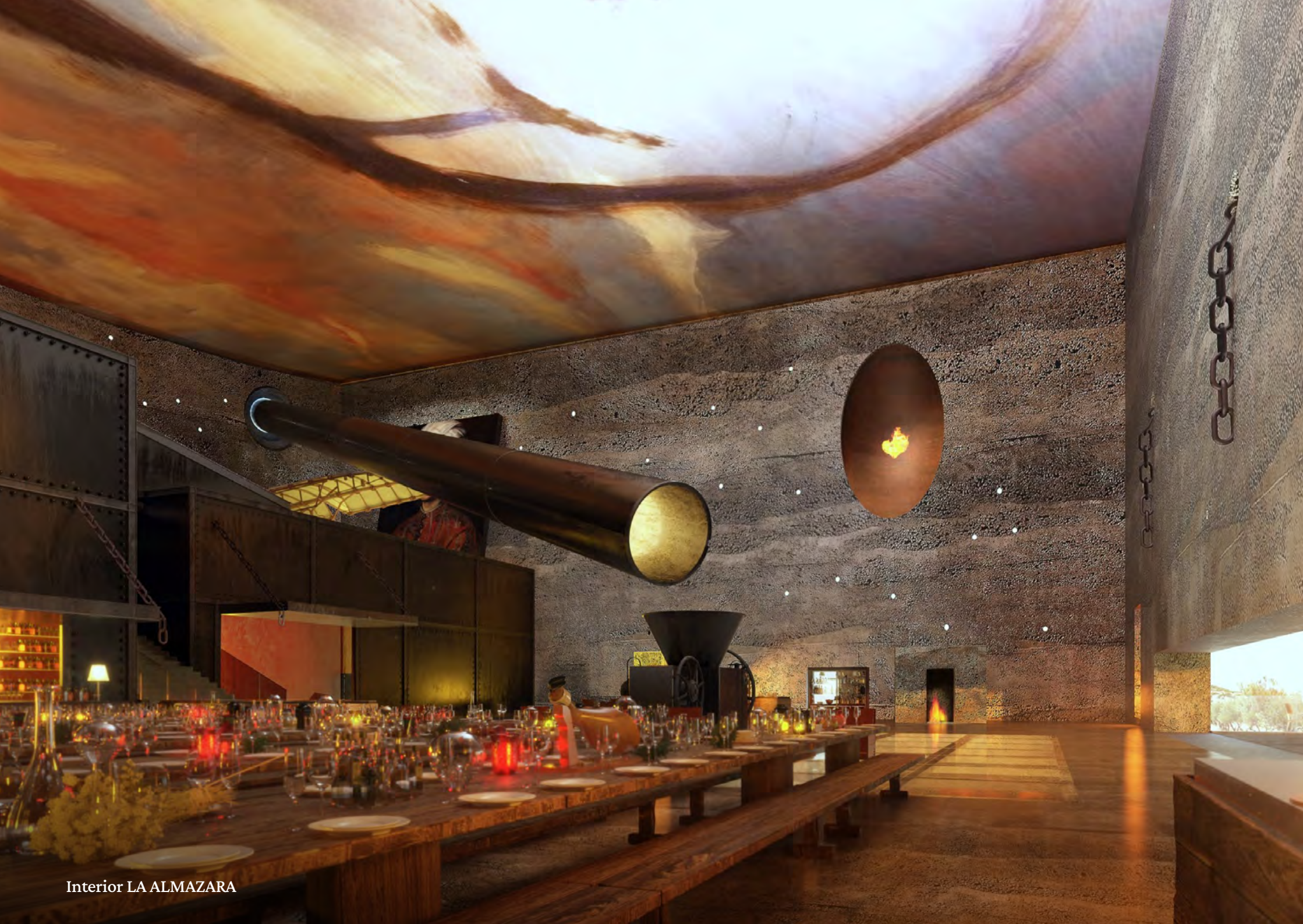
Interior LA ALMAZARA